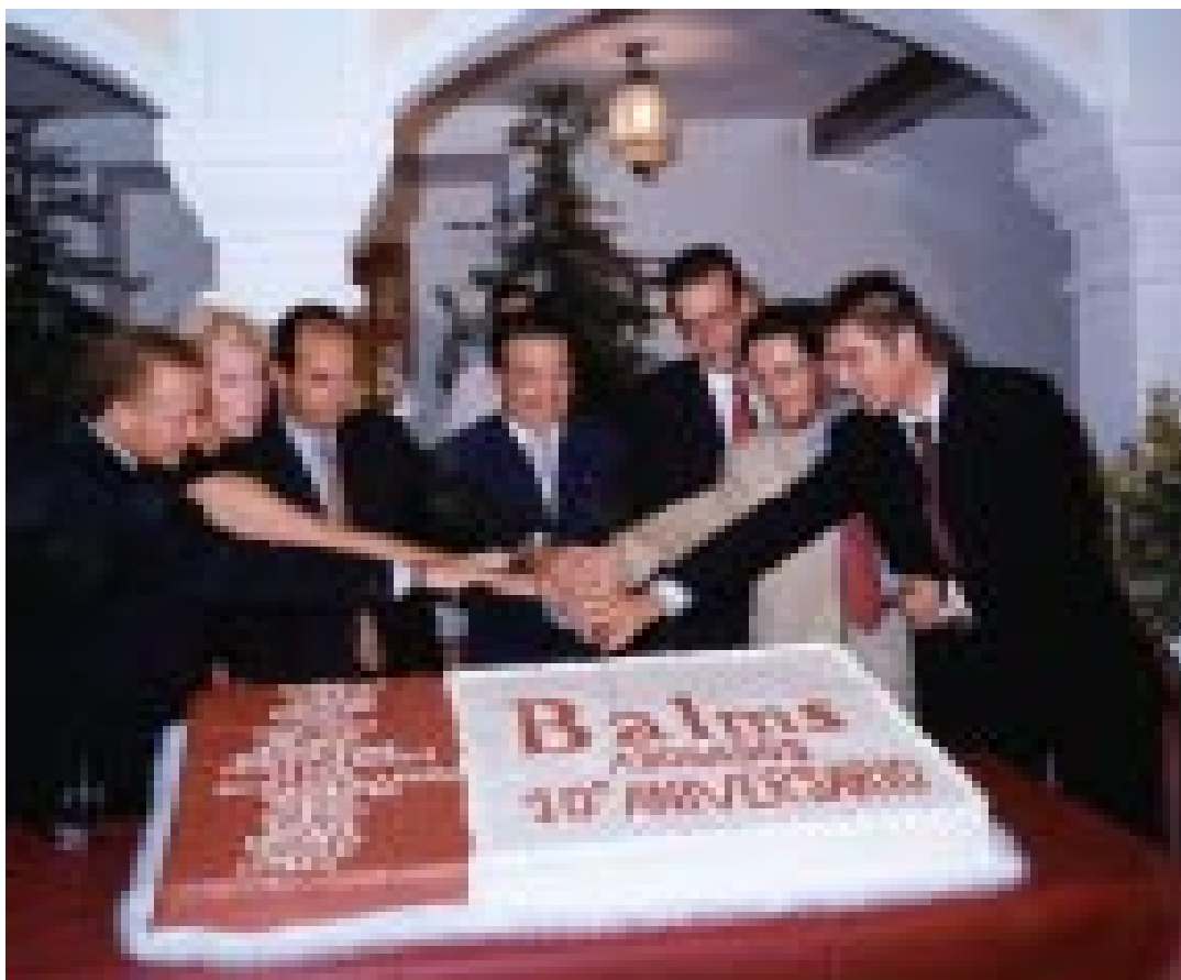
Uno para todos, Todos para uno

Pero a doble celebración, doble escena: Unido a la plaza por una alfombra color burdeos, el despacho de Balms Abogados fue centro de atención y de encuentros durante toda la noche, los anfitriones guiando sus invitados por despachos y salas de juntas, quién quedándose hojeando los tomos del siglo XVIII, y quién observando los detalles de los muebles estilo colonial, que a partir de ahora adornan y ambientan esta nueva etapa de Balms Abogados, con el doble de espacio...y el mismo espíritu Balms.