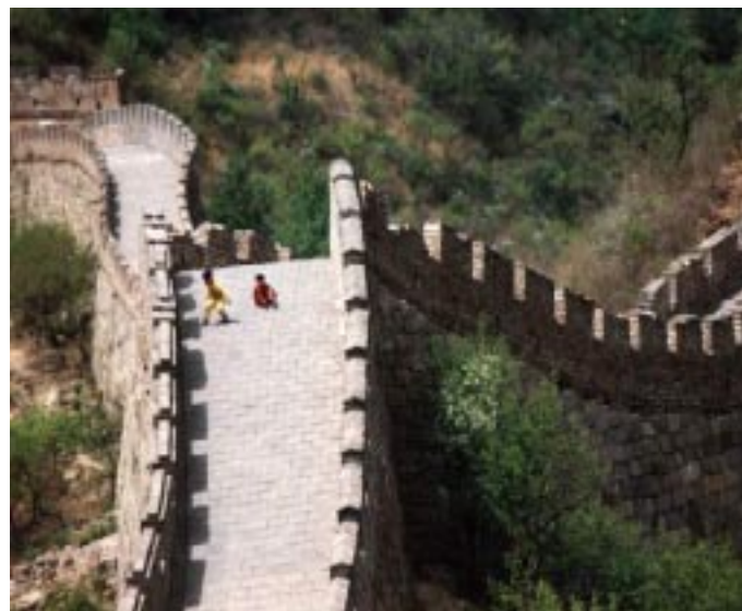
The Great Wall of China

The WTO agreement although talks about binding commitment on member countries and sets out rules and regulations in respect of trading environment with a view to achieve a more transparent and fair base economic system, there are other major issues which are not dealt with in the WTO structure but will fundamentally affect the rate and nature of real change going forward, e.g. licensing of new telecom service entrance, Renminbi convertibility, the freeing up of interest rates and the viability of China's banking system. It is also important to note that in many sectors, WTO-induced changes in China will only be an additional force applied to an already dynamic business terrain. As mentioned earlier, in some industries, rapid or fundamental change is underway.