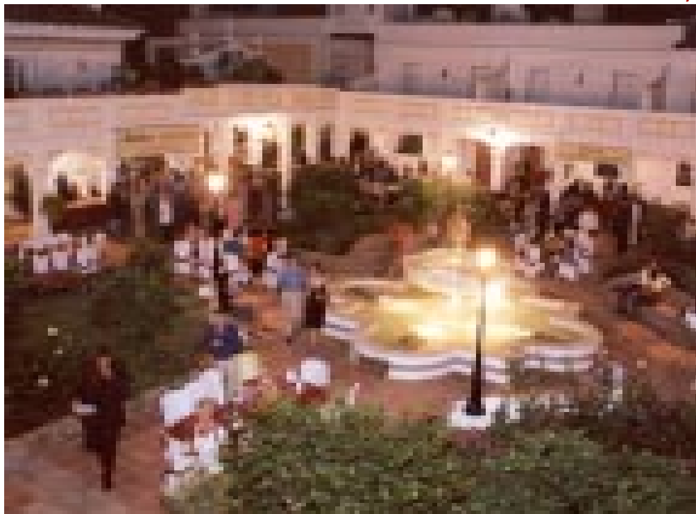
All for one and one for all