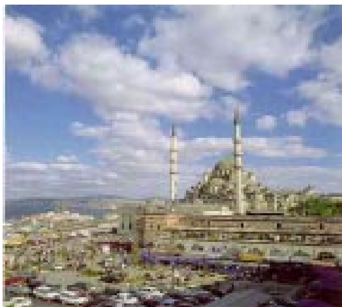
Palacio de Topkapi

Valoramos la actitud flexible y la determinación del equipo dirigente político durante los últimos cinco meses. Los resultados del gobierno han sido mejores de lo que se podía esperar de una coalición. Todos nos centramos en el programa económico. La determinación