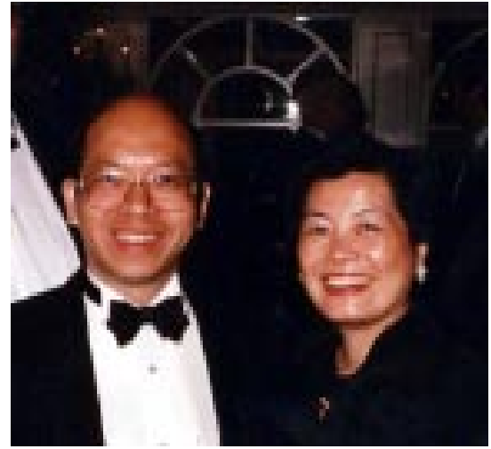
Mr and Mrs To

Otra fuente de preocupación es el hecho de que el flujo de inversión extranjera directa ha